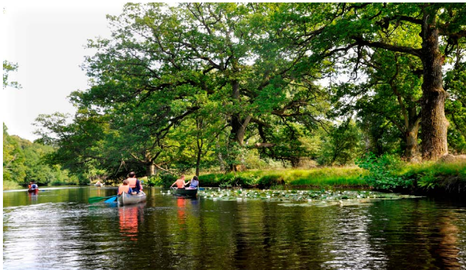
Vilken lycka att färdas på Alsterån. Foto av Mats Wingborg, se titel nr 430.

Till sist en fråga som ställs av en kvinna i bygden, jag återger hennes uttalande i mitt bidrag i boken ”Småland – en kärleksförklaring” (nr 430). Kanske hennes ord kan få bli till slogan för hela Mönsterås och inte endast för den aktuella byn i Ålem: Varför ska man ut och resa när det är så vackert i Åslemåla?